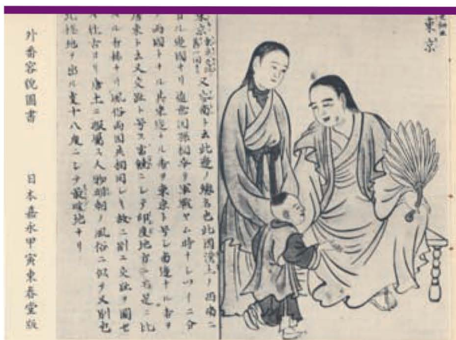
选自外番容貌图书

椰阴馆馆藏的大部分藏书是在1920至1950年间出版,有关中国华侨南来的游记、华侨历史沿革、华侨教育发展、华侨信仰风俗习惯、南洋历史等,都是育崧先生生平研究的课题。馆藏也包括了刻于乾隆58年(1793)的《海国见闻录》,一部研究海交史的重要资料,和刻于道光19年(1839)的《厦门志》,厦门历史上第二部方志,和其他一些明清时代的线装书。陈育崧先生捐赠的书籍,现收藏于李光前参考图书馆十楼的阅览室。