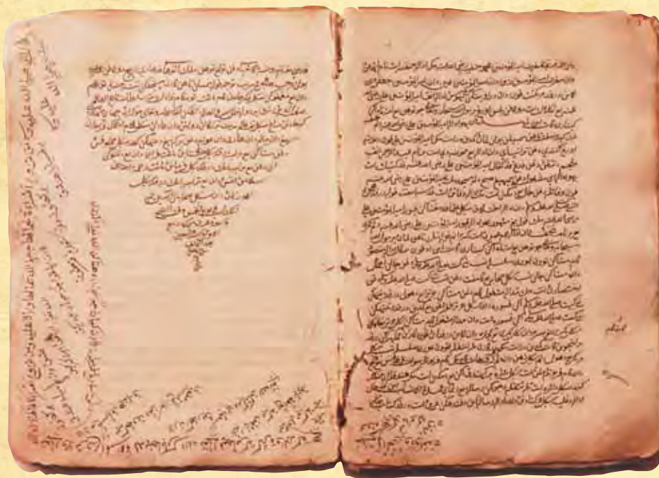
Khalq al-samawat wa al-ard (1637 Masehi) Manuskrip karangan Sheikh Nuruddin ar-Raniri yang membicarakan asal kejadian langit dan bumi

Batu Bersurat Terengganu membuktikan dengan jelas bahawa