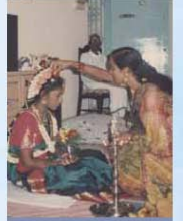
பூப்பு நீராட்டு விழாச் சடங்கு

நீராடச் செய்து தாய்மாமன் சீதனமாகக் கொண்டுவந்த நகை, ஆடை ஆகியவற்றைக் கொடுத்து அணியச் செய்வர். பழம், வெற்றிலை, பாக்கு, மஞ்சள் கிழங்கு, தேங்காய் முதலியவற்றைச் சேலை முந்தானையில் கொட்டி மடி நிரப்புவர். தாய்மாமன் மாலை அணிவித்து சடங்கை முடித்து வைப்பார். அன்று வீட்டிற்கு வந்த உற்றார் உறவினர் நண்பர்கள் அனைவருக்கும் விருந்து படைப்பர். அக்காலத்தில் இப்பெண் திருமணம் செய்வதற்கு ஏற்றவள் என எல்லாருக்கும் பறைசாற்றுவதற்காக இச்சடங்கு ஏற்படுத்தப்பட்டது. அத்துடன் தாய்மாமனுக்கு இவ்விழாவில் முதலிடம் கொடுப்பது, சனோதரீபின் பிள்ளைகளைத் தந்தைபோல் இழுந்து கவனித்துப் பேணுவார் என்பதாகும்.