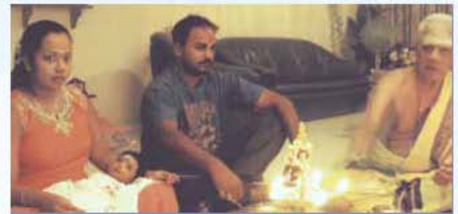
பதினாறாம் நாள் நடைபெறும் சடங்கு

குழந்தை பிறந்த 16ஆம் நாள் நடக்கும் இச்சடங்கில் இதுநாள் வரை தனித்து இருந்த தாயும் சேயும் அன்று எண்ணெய் தேய்த்து நீராடிப் பிறகு அறையை விட்டு வெளியே வருகின்றனர். அன்று கணவர் வீட்டிலிருந்து அனைவரும், நெருங்கிய சற்றத்தாரும் வந்து குழந்தையை ஆசீர்வழிக்கின்றனர். குழந்தைக்கு வளையல், தண்டை, காப்பு, அரைஞாண் போன்றவற்றை அணிவிப்பர். இரண்டு பாண்களில் வெண்பொங்கல் மற்றும் சர்க்கரைபொங்கல் செய்து இறைவனுக்குப் பலடைக்கின்றனர். பிறகு குழந்தையின் தாயும் தந்தையும் இறைவனை