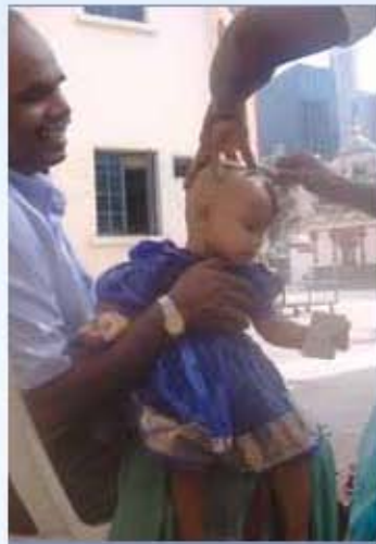
முடி இறக்கும் வைபவம்

பிறகு குழந்தையை நீராட்டி புத்தாடை அணிவித்துத் தலையில் அரைந்த சந்தனத்தைப் பூசுவர். மீண்டும் தாய்மாமன் மடியில் உட்காரவைத்துப் பொற்கொல்லரைக் கொண்டு குழந்தைக்குக் காது குத்திக் காதணி அணிவிப்பர். இச்சடங்கு முடிந்ததும் எல்லோருக்கும் காப்பரிசி (பச்சரிசி, பாசிப்பருப்பு, எள்ளு, வெல்லம் கலந்த கலவை) வழங்கப்படுகிறது. பிறகு அனைவருக்கும் விருந்தளிக்கும்படி.