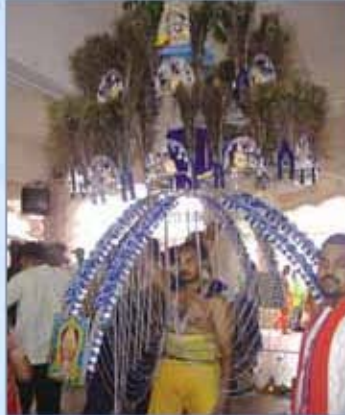
அலகுக் காவடி எடுக்கும் பந்தர்

உள்ள அனைத்து சிவன் கோயில்களிலும், முருகன் கோயில்களிலும் கைப்பூசம் சிறப்பாக நடைபெறுகிறது. ஆனால் மற்ற நாடுகளைவிட சிங்கப்பூரிலும் மலேசியாவிலும் மிகக் கோலாகலமாக இத்திருவிழா நடைபெறுகிறது. சிறுவர் முதல் குதியோர் வரை பால் குடம், பால் காவடிகள், அவகுக் காவடிகள் எடுத்தும், தேர் இழுத்தும், தங்கள் வேண்டுகோள்களை நிறைவேற்றிக்கொள்கின்றனர். அதிகாலையில் ஒரு மணிக்குத் தொடங்கி மறுநாள் நள்ளிரவு வரை சிராங்கூன் சாலைப் பெருமாள் ஆலயத்திலிருந்து டேங்க் ரோடு தண்டாயுதபாணி ஆலயத்திற்கு வரிசையாகச் செல்லும் பலவகையான அலகுக் காவடிகளை ஏராளமான வெளிநாட்டுச் சுற்றுப் பயணிகள் வியப்புடன் கூடிப் பார்ப்பதைக் காணலாம். கைப்பூச நாளில் பெருமாள் ஆலயத்திலும் தண்டாயுதபாணி ஆலயத்திலும் வரும்