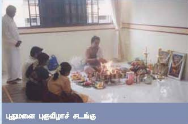
புதுமனை புகுவிழாச் சடங்கு

குடும்பத்தினர் தமது இல்லத்தில் கொண்டாடும் விழாக்களைக் குடும்ப விழா எனலாம். அவை குடும்பத்தினரின் சமயம் சார்ந்தவையாகவும் சடங்குகளோடு இணைந்தவையாகவும் உள்ளன. பிறப்பு முதல் இறப்பு வரையிலான பல சடங்குகள் காலத்தின் வளர்ச்சியில் இன்று விழாக்களாக உருவெடுத்துள்ளன. இங்கு கொண்டாடப்படும் விழாக்களில் புதுமனை புகுவிழா, அறுபதாம் ஆண்டு விழா, காதுணிவிழா, பூப்புநீராட்டு விழா, மணவிழா, வலனகாப்பு விழா போன்றவை சிறப்பாகக் கொண்டாடப்படுகின்றன.