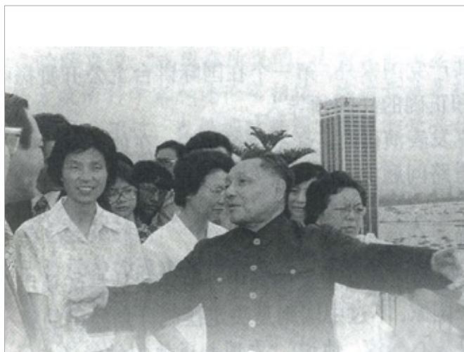
1978年邓小平在新加坡参观访问。