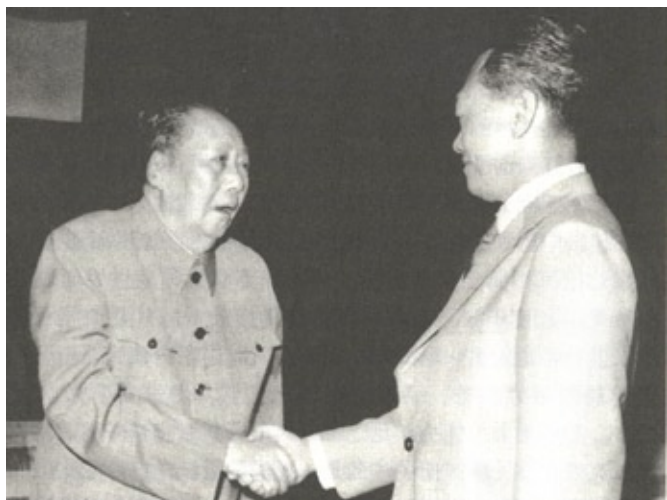
1976年5月12日，李光耀与当时的中国最高领导人毛泽东主席见面。 资料来源：《李光耀回忆录1965-2000》 版权属新加坡《联合早报》所有，2000。

资料来源：《为了世界更美好——江泽民出访纪实》，第79页。版权属世界知识出版社所有，2006。