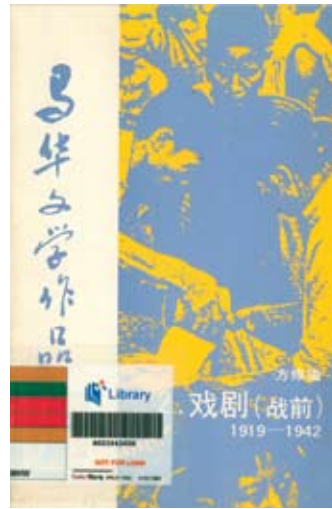
马来西亚华校董事联合会总会(董总)版权所有，1988。