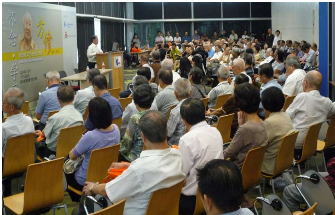
在新加坡国家图书馆举行的“怀念方修、学习方修”纪念会现场。

方修先生是新马华文文学的拓荒与奠基者。他曾在报界服务长达37年，其中20余年任职新加坡《星洲日报》从事编辑工作。凭着坚韧的意志力，穷毕生精力，在自资、自助的情况下，方修先生从蕴藏丰富文史资料的旧报纸、杂志堆中