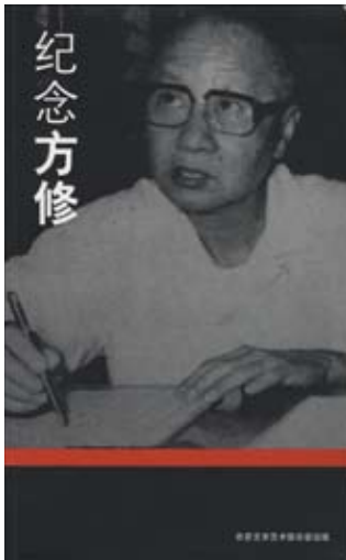
配合纪念会发布的这本书收录51篇文章。热带文学艺术俱乐部版权所有，2010。