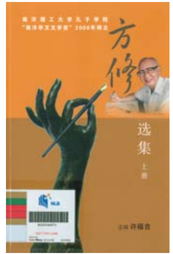
八方文化创作室版权所有，2009。

发掘、研究与整理马华新文学史料，并编纂了《马华新文学大系》、《马华新文学史稿》、《马华新文学选集》、《战后新马文学大系》、《马华文学作品选》及《战后马华文学史初稿》等著作。方修编著的作品超过一百部，其中包括散文、文学评论、诗歌等。他是第一位将新马华文文学史介绍给全世界的本地先驱作家。