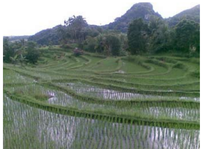
Pemandangan sawah padi di Pulau Bawean.

Pondok selalunya merupakan rumah kedai bertingkat atau banglo dengan unit-unit bilik kecil untuk setiap keluarga, sementara ruang tamu, ruang solat, dapur serta bilik dikongsi