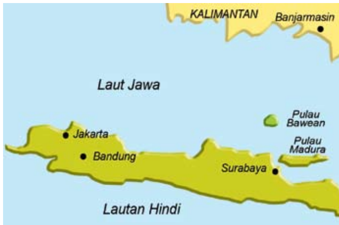
Lokasi Pulau Bawean, Indonesia.

Kaum Bawean dipercayai mula merantau ke Singapura seawal tahun 1824 dengan menaiki kapal Bugis 11 dan kemudian dengan kapal-kapal wap milik Belanda Koninklijke Paketvaart Maatschappij (KPM) dan Heap Eng Moh Shipping Company (syarikat-syarikat pengendali pelayaran di kepulauan Indonesia). 12