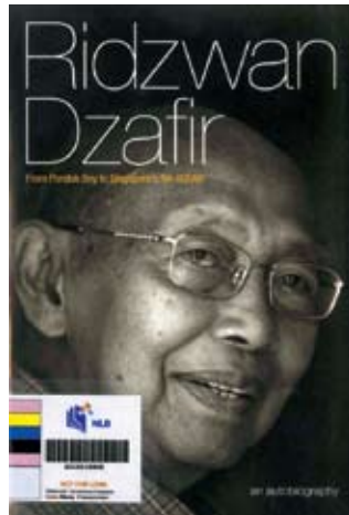
Pencapaian anak pondok, diabadikan.

Dalam konteks kesusasteraan Melayu dan sejarah Singapura umumnya, koleksi syair ini merupakan bahan nadir mengenai kaum-kaum perantau pada era 1920-an hingga sebelum Perang Dunia Kedua. Selain usia karya ini, isinya berkisar tentang keadaan sebenar masyarakat Bawean pada itu. Bentuk karya bersyair-pantun begini tentang orang Bawean