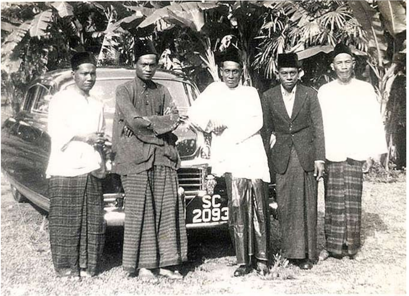
Gambar kaum lelaki Bawean di tahun 1950-an.

bersama penghuni lain. Terdapat antara 10–30 buah keluarga hidup di bawah satu bumbung pondok. Nama setiap pondok di Singapura biasanya diberikan sempena desa asal di Bawean kerana kaum ini didapati amat tebal jati diri serta nilai etnosentrisme mereka. Mereka mahu dikenali sebagai orang dari desa asal mereka misalnya orang-orang Tambak, Gelam, Pakherbung dan lain-lain.