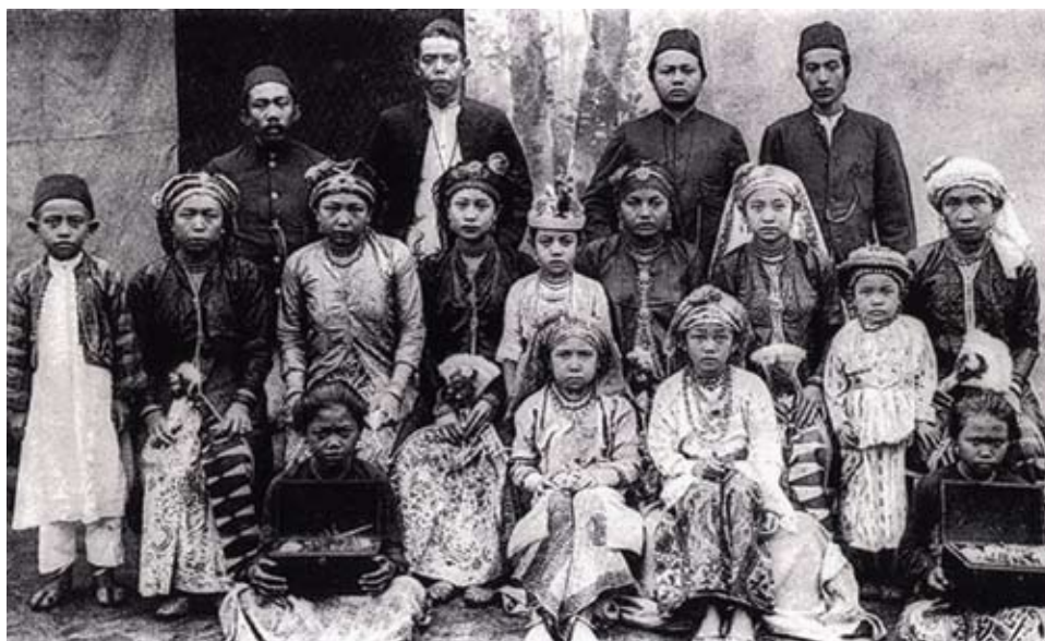
Masyarakat Bawean Singapura, 1910.

Terdapat perkataan-perkataan dan frasa yang sukar ditranskripkan secara langsung antaranya; “Di pondok ramai orang Traisi ” (ms. 26) dan “Bila malam memakai pat-pat ” (ms. 38). Masalah susunan aksara Jawinya yang kabur dan tanda-tanda seperti titik yang kurang lengkap sebagai menuruti konvensyen huruf-huruf Hijaiyah agak mengelirukan. Misalnya “Perintahlah dahulu terluca ” (ms. 41). Di samping itu struktur barisan dari bait pertama hingga ke bait terakhir tidak dipisahkan secara berperenggan. Untuk memudahkan rujukan, penulis menomborkan setiap 1,964 baris. Bait-bait ini dikekalkan nombor halaman teks Jawi asalnya. Penulis mengatasi penguasaan bahasa Baweannya yang terhad dengan merujuk kepada saudara mara untuk menakrifkan frasa-frasa yang tidak dapat dihuraikan.